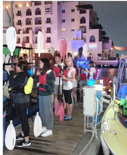
Sortie kayak full moon à l'Eastern Mangrove