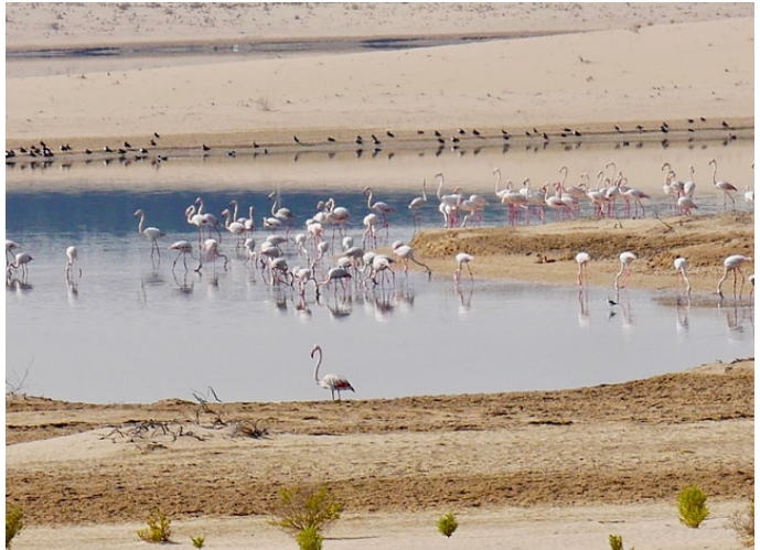
Sortie à la réserve d'Al Wathba