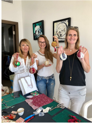
Atelier boules de Noël