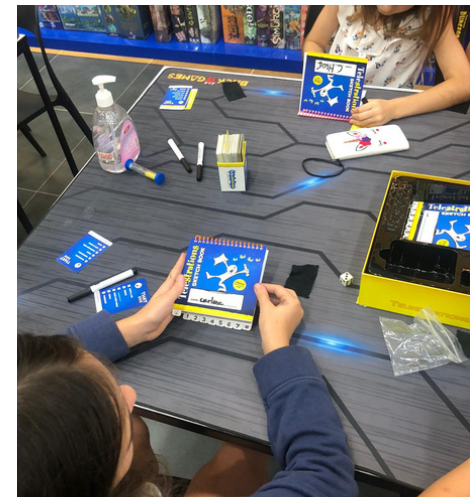
"Jouons ensemble" à la boutique "Back to Games" à Abu Dhabi Mall