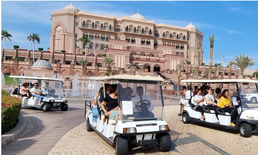
Visite de l'Emirates Palace