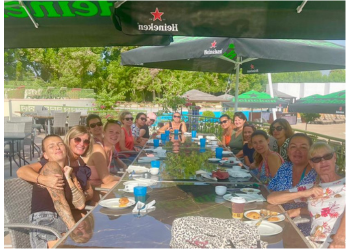
Petit-déj' piscine du Q5 à l'Abu Dhabi Golf Club