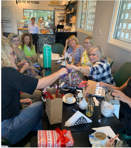
Suprise Santa Café du Q1

L'année 2022 s'est terminée dans la joie et la bonne humeur.