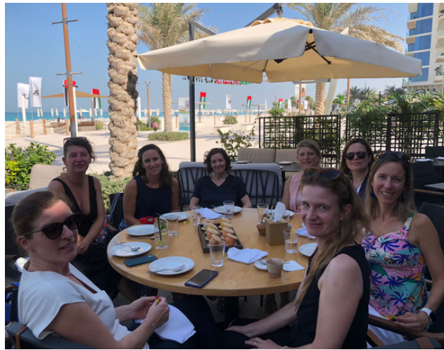
Déjeuner du Q3 chez Niri