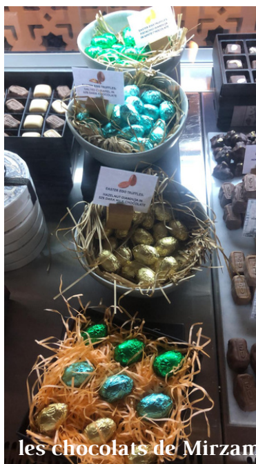
les chocolats de Mirzam

Vous trouverez aussi un large choix de décorations, de chocolats, sur le site de Kibsons .