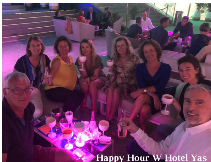
Happy Hour W Hotel Yas