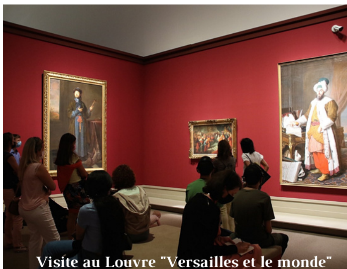
Visite au Louvre "Versailles et le monde"