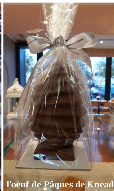
l'oeuf de Pâques de Knead

Vous pourrez également trouver des beaux rayons de Pâques dans les grandes surfaces telles que Carrefour , Lulu hypermarket , Waitrose , Marks and Spencer à Yas , ou encore le Spinneys , situé près de l'Alliance française !