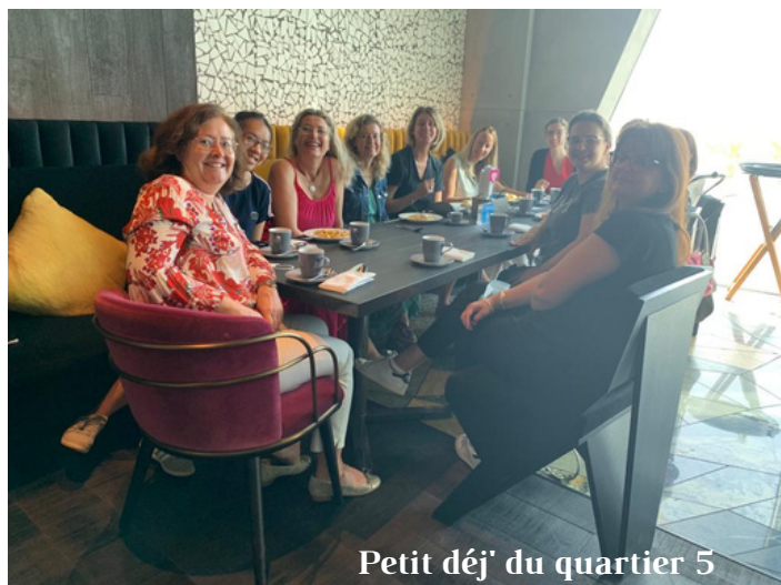
Petit déj' du quartier 5