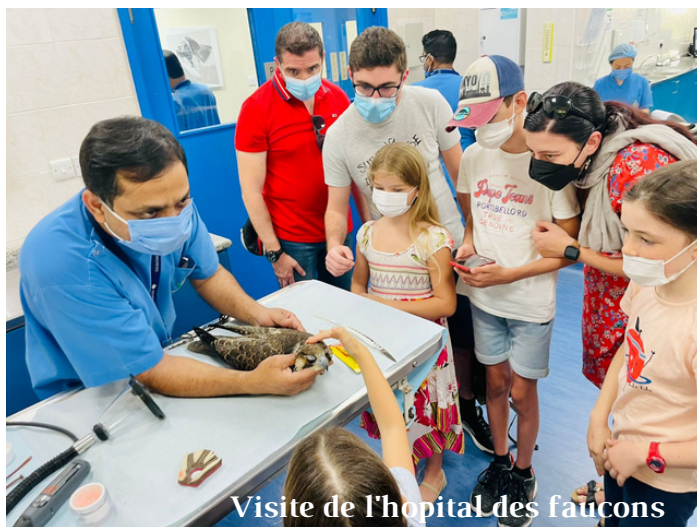
Visite de l'hôpital des faucons