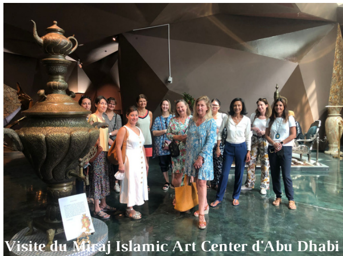
Visite du Miraj Islamic Art Center d'Abu Dhabi

Retour en images sur nos événements du mois de mars. Comme à chaque fois, c'est dans la joie et la bonne humeur que nous nous sommes retrouvés le mois dernier autour d'un café, d'un apéro ou à l'occasion d'activités culturelles, créatives, sportives, ou encore culinaires!