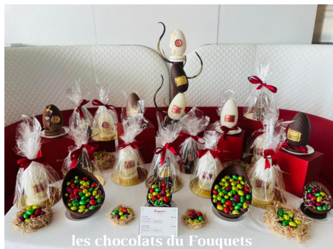
les chocolats du Fouquets

Vous trouverez aussi un large choix de décorations, de chocolats, sur le site de Kibsons .