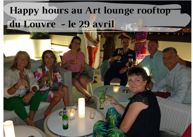
Happy hours au Art lounge rooftop du Louvre - le 29 avril