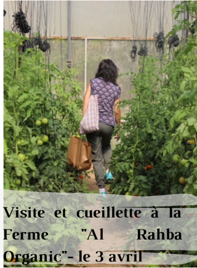
Visite et cueillette à la Ferme "Al Rahba Organic" - le 3 avril