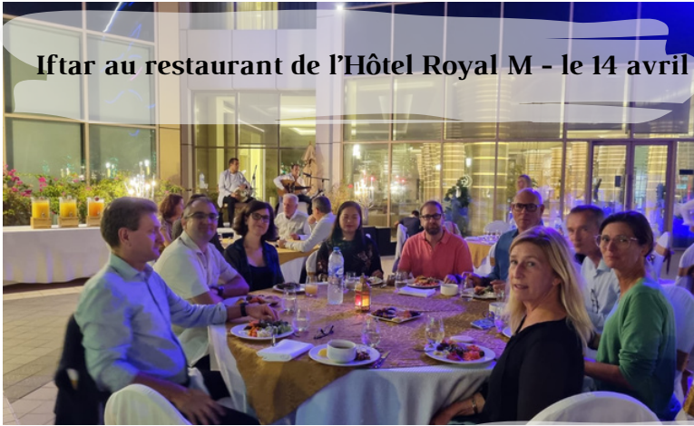
Iftar au restaurant de l'Hôtel Royal M - le 14 avril