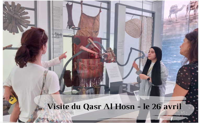
Visite du Qasr Al Hosn - le 26 avril