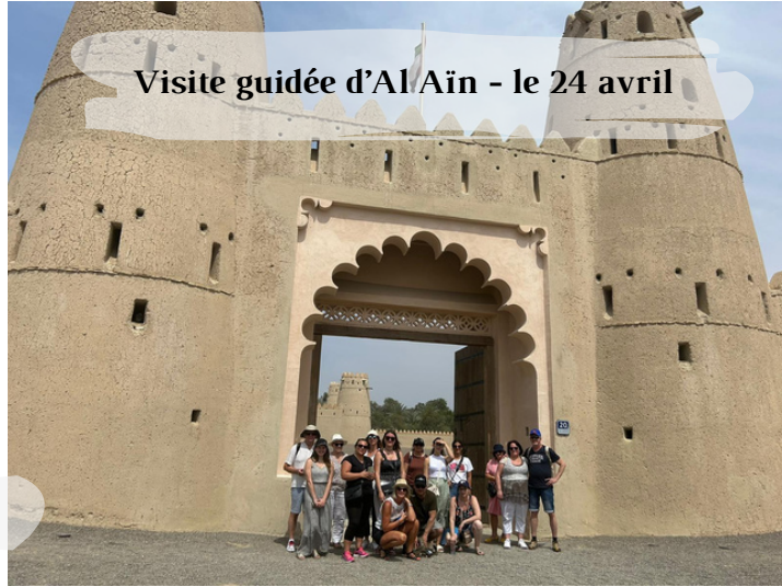
Visite guidée d'Al Ain - le 24 avril