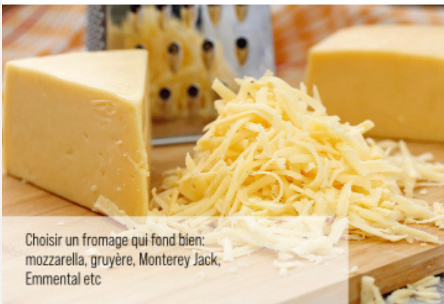
Choisir un fromage qui fond bien: mozzarella, gruyère, Monterey Jack, Emmental etc

! Pour se simplifier la vie: - Acheter le fromage déjà râpé - Acheter les tortillas au rayon boulangerie - Ne prendre comme ingrédients en plus du fromage que ce que vous avez au frigidaire. Les enfants comme les adultes se régaleront quand-même!