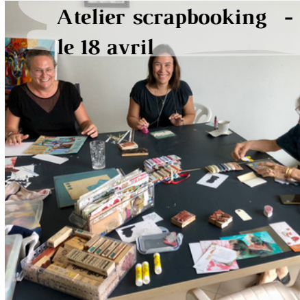
Atelier scrapbooking - le 18 avril