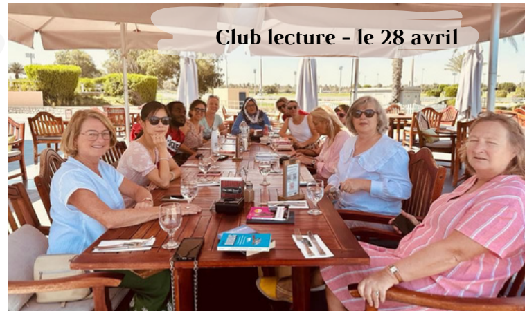
Club lecture - le 28 avril