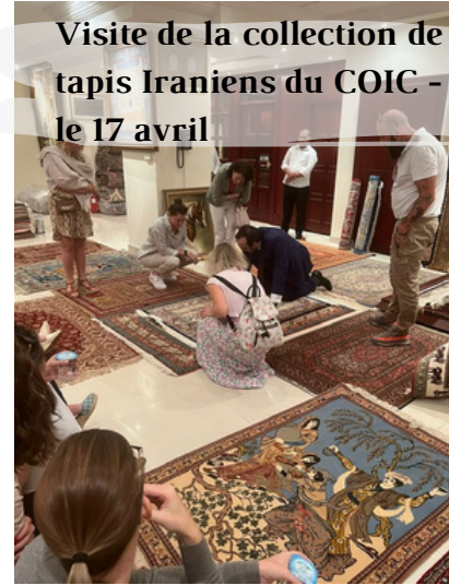
Visite de la collection de tapis Iraniens du COIC - le 17 avril