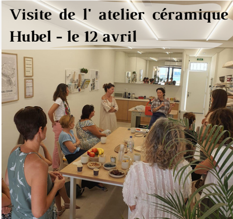
Visite de l'atelier céramique Hubel - le 12 avril