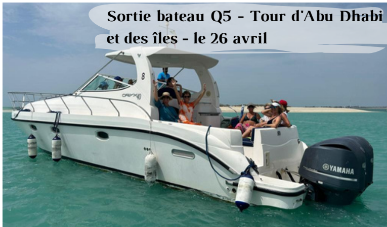
Sortie bateau Q5 - Tour d'Abu Dhabi et des îles - le 26 avril